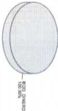
Distribución del Patrimonio